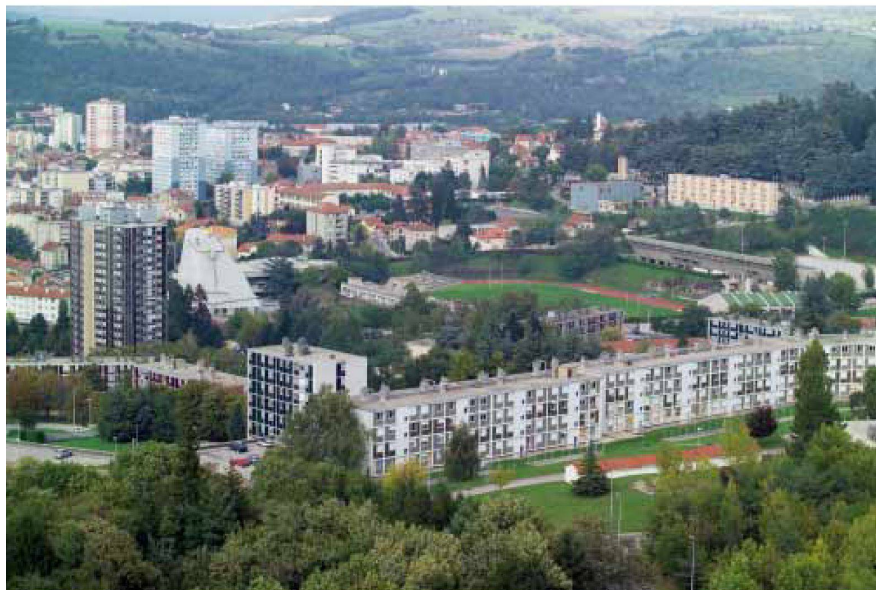
Bilder: Alhard van der Horst

Der unfertige Zustand der Kirche hielt den französischen Staat nicht davon ab, sie 1995 unter Denkmalschutz zu stellen und einen Abriss, den manch ein Politiker zuvor gefordert hatte, unmöglich zu machen. Letztlich einigten sich Provinz und Gemeinde deshalb 2001 auf den Weiterbau, obwohl Firminy gar keine Kirche mehr brauchte. Im Städtchen hofft man natürlich auf eine Ankurbelung des Tourismus durch die posthume Realisierung des Entwurfs, der das Bauensemble des weltbekannten Architekten komplettiert. Um das Luxusprojekt ein wenig rentabler zu machen, sollen die Räume im Sockel als Filiale des Kunstmuseums von St. Etienne genutzt werden, anstatt, wie ursprünglich vorgesehen, für Aktivitäten der Pfarrgemeinde. Mit der Ausarbeitung der fast vierzig Jahre alten Pläne wurde José Oubriere beauftragt, ein ehemaliger Mitarbeiter von Le Corbusier, der bereits am Vorentwurf beteiligt gewesen war.