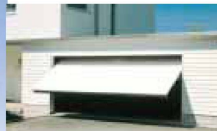
Hartmann öffnet Ihnen Tür und Tor: automatische Garagentore