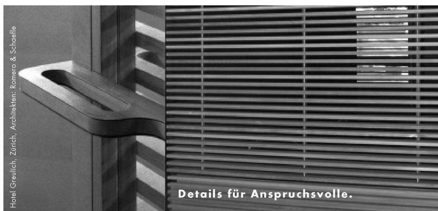
Hotel Greulich, Zürich, Architekten: Romero & Schaeffle

Die beiden übernahmen den Auftrag parallel zu ihrem Masterstudium und machten sich in einer intensiven Recherche kundig über die Geschichte englischer Pubs. Dabei entdeckten sie,