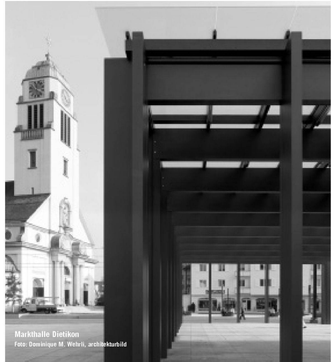
Markthalle Dietikon

Prädikat «Gute Form» ausgezeichnet, ist der bequeme wie robuste Liegestuhl heute ein Klassiker im Bereich der Gartenmöbel. Der Stuhl wird seit 1971 durch die Embru-Werke vertrieben und kann im gehobenen Designmöbel-Fachhandel bezogen werden. Das feuerverzinkte Rohrgestell wird in der Luzerner Stiftung Brändi mit den Kunststoff-Kordeln bespannt und ist in den Farben Gelb, Grün, Hellblau, Weiss, Schwarz und Rot erhältlich. Embru-Werke, Mantel & Cie CH-8630 Rüti www.embru.ch