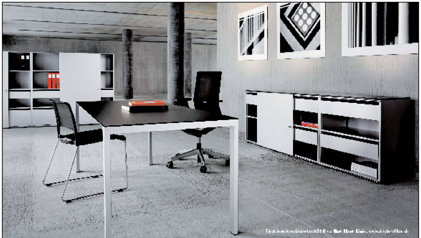
Tisch kann kombiniert mit Box, Mat, Tisch, www.biglaoffice.ch

Tuchs Schmid AG CH-8501 Frauenfeld Telefon +41 52 728 81 11 www.tuchschmid.ch