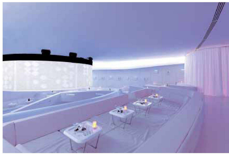
Vertigo in Zürich; Bar, Essbereich, Schnitt