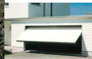
Hartmann öffnet Ihnen Tür und Tor: automatische Garagentore