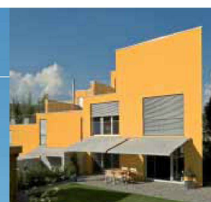
Hartmann bietet Lebensqualität: Sonnen- und Wetterschutz