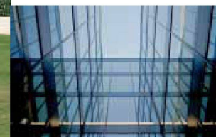
Hartmann setzt visionäre Architektur um: Fassadenbau