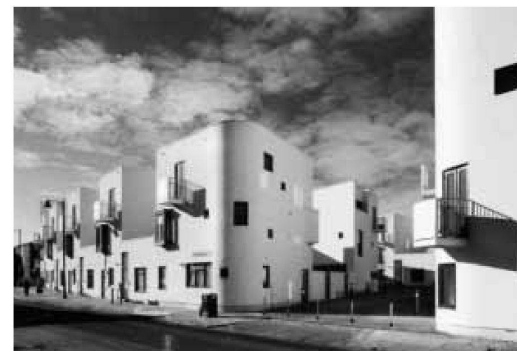
London, Donnybrook Quarter in Bow (Tower Hamlets). Wohnüberbauung von Chris Barber, 2006

Entstanden ist ein anregendes Panoptikum historischer und aktueller Wohnmodelle für jene anspruchsvollen gesellschaftlichen Gruppen, die es sich leisten können, ihre Wohnform zu wählen.