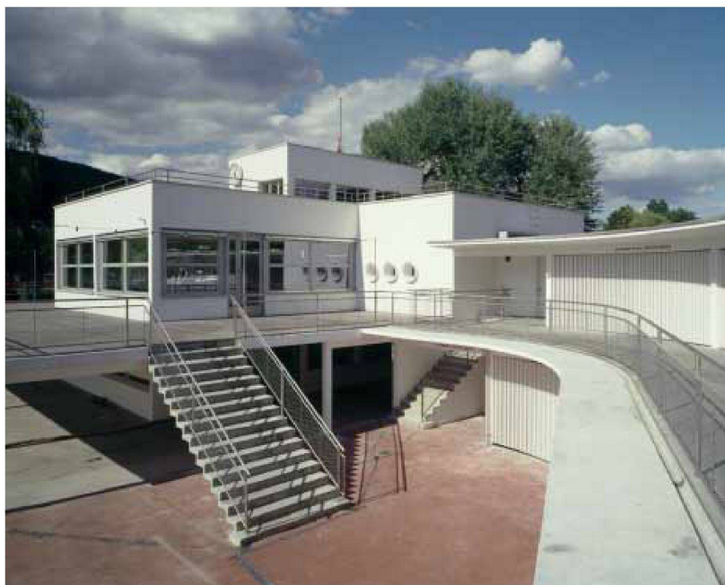
Strandbad Nidau, 1929–32, Otto Schaub. Am diesjährigen Tag des Denkmals zu besichtigen.

Die Sensibilisierung der Öffentlichkeit ist notwendig, aber nicht ausreichend, um die notwendigen Voraussetzungen zur Entwicklung und Verwirklichung einer Architektur und eines Städtebaus von hohem Wert zu schaffen. Hauptsächliche Voraussetzung für eine qualitativ hochstehende architektonische Produktion ist und bleibt eine entsprechend hochstehende Ausbildung. Mehr als hundert BSA-Mitglieder sind in der Schweiz und im Ausland als Lehrpersonen für Architektur tätig. Bisher hat der BSA nicht versucht, diese Beziehungen auszunützen. Bis auf wenige Ausnahmen sind es nämlich nicht dieselben Mitglieder, die innerhalb des BSA und an den Architekturschulen tätig sind. Es wäre deshalb sehr nützlich, wenn wir uns abstimmen könnten, um gemeinsam die wichtigsten Stossrichtungen festzulegen, und zwar auf den verschiedenen Ausbildungsstufen. Wenn es auch keine Schule mehr gibt, sondern auf allen Stufen nur noch «Hochschulen», möchten unsere Büros doch diplomierte Zeichner, Techniker und praktisch ausgerichtete Architekten oder Bauleiter einstellen, die ihre Grundkompetenzen auf unterschiedlichen Wegen erworben haben. Diese heute selten gewordenen Kompetenzen sind notwendig, um den Fortbestand einer schweizerischen Besonderheit in der