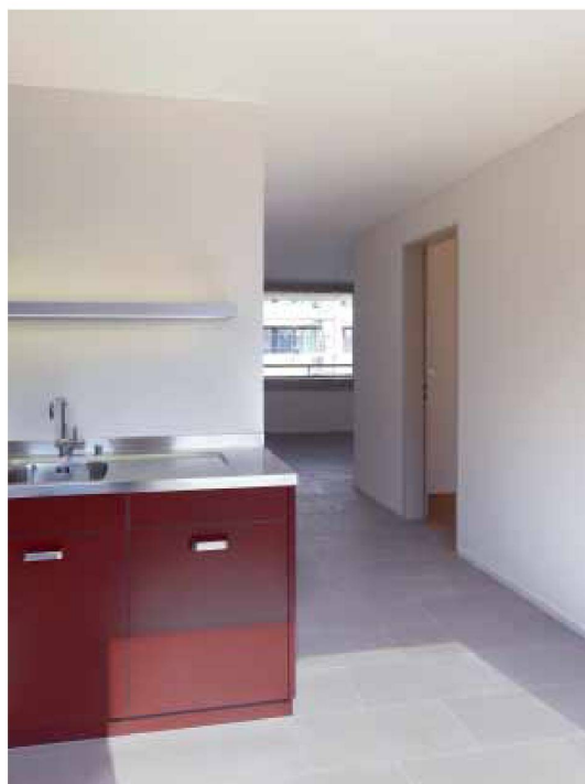
Küche und Wohnraum verschränken sich über das Entrée in einer Z-förmigen Raumfigur

dieser Nachbarschaft noch weitere Antworten zu Fragen nach öffentlichem und privatem Raum, etwa in einer gemeinschaftlichen Nutzung des Erdgeschosses oder einer spezifischen Gestaltung der Zeilenenden zum Strassenraum hin. Die innenräumliche Adaption des Herumziehens der Fassade um den gesamten Baukörper oder das Drehen der Grundrissausrichtung an den Gebäudeenden könnten hier eine Erwägung wert sein.