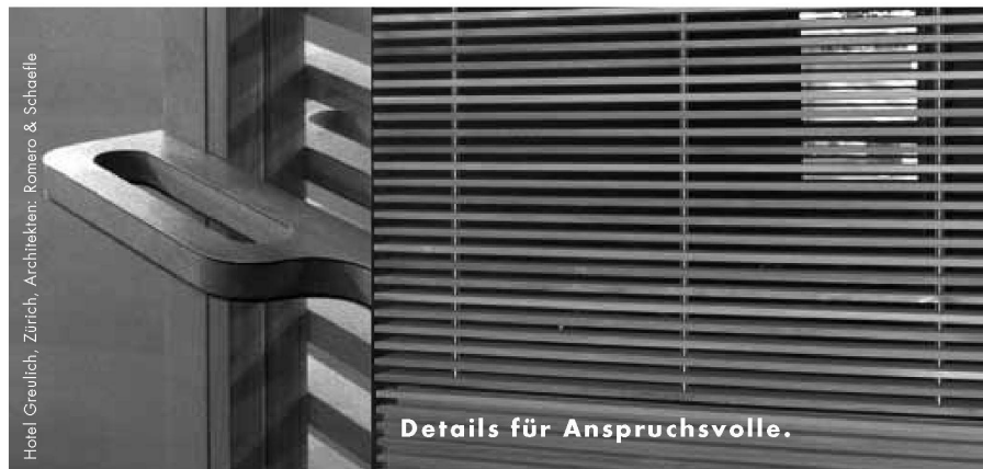
Hotel Greulich, Zürich, Architekten: Romero & Schaeferle