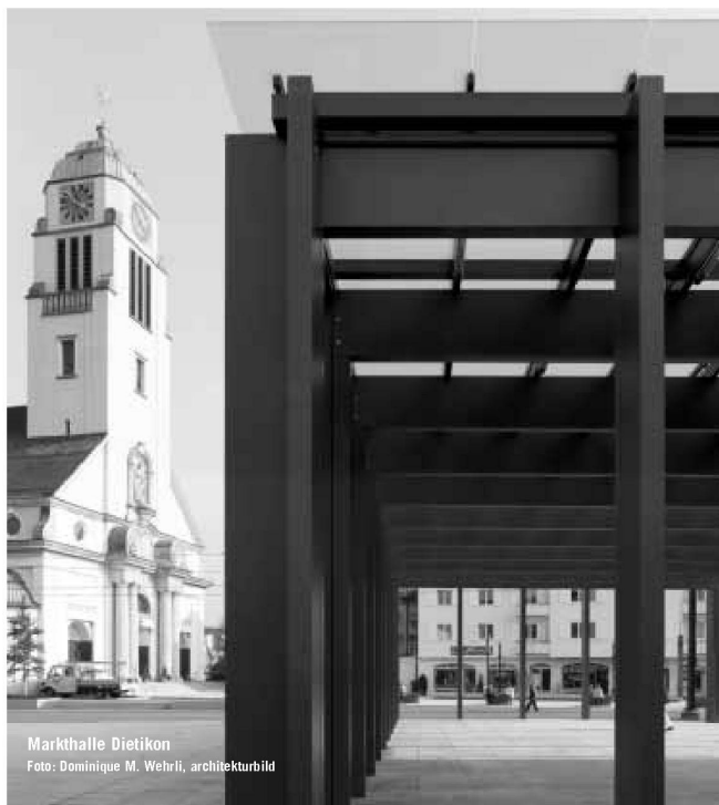
Markthalle Dietikon

Partner für anspruchsvolle Projekte in Stahl und Glas