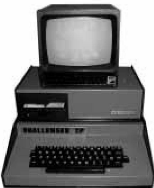
Ohio Scientific 2P Computer, 1979.

Diesen beiden Spielarten entsprechen zwei Dimensionen des Archaischen, die sich immer wieder unterscheiden lassen. So ist es einerseits das Einfache, Elementare, noch Unentwickelte, kann andererseits aber genauso durch Unklarheit und mangelnde Elaboreiertheit auffallen. Im einen Fall ist das Archaische anfänglich im Sinne von schlicht; es bietet sich als Grundlage für weitere Entwicklungen an, ist die Basis für Kom-