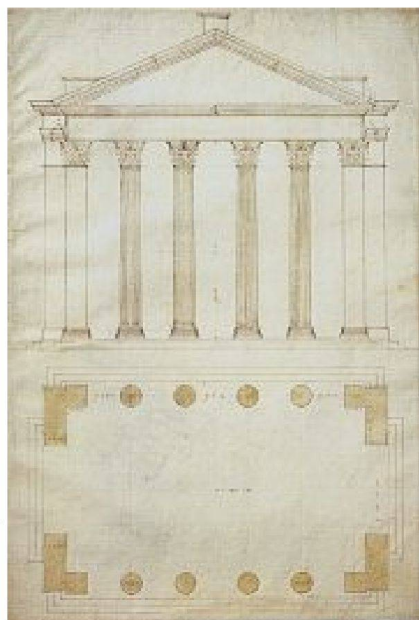
Andrea Palladio, Grundriss und Aufriss des Portikus der Otavia in Rom, nach 1550

Ausstellung «Andrea Palladio: His Life and Legacy», Royal Academy of Arts, London, bis 13. 4. 2009. Katalog herausgegeben von Guido Beltrami und Howard Burns für £27,95 (Softcover). Weitere Stationen der Ausstellung: Caixaforum Barcelona, 19. 5.–6. 9. 2009; Caixaforum Madrid, 6. 10. 2009–17. 1. 2010.