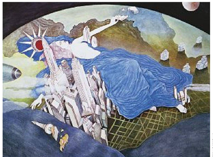
Ecstasy of Mrs Caligary, 1973