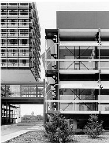
Egon Eiermann, Verwaltungs- und Ausbildungszentrum der Deutschen Olivetti, Frankfurt a. M., 1968-1972; Aufnahme 1974