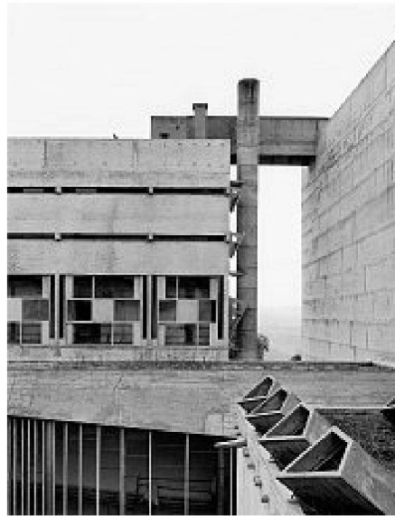
Le Corbusier, Kloster Sainte-Marie-de-la-Tourette, Eveux-sur-L'Arbresle, 1957-1960; Aufnahme 1987