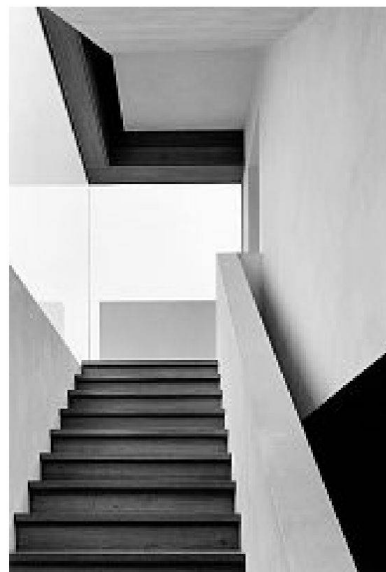
Herzog & de Meuron, Sammlung Goetz, Haus für eine zeitgenössische Kunstsammlung, München, 1991/92; Aufnahme 1995

Er wolle Architektur zeigen, wie sie ist, sagt Klaus Kinold. Oder, «wie ich mir vorstelle, dass der Architekt sie gesehen haben will.»