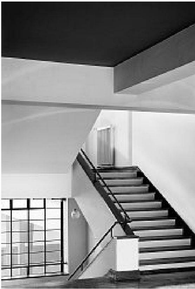
Walter Gropius, Bauhaus Dessau, Haupttreppenhaus, 1925/26; Aufnahme 1988