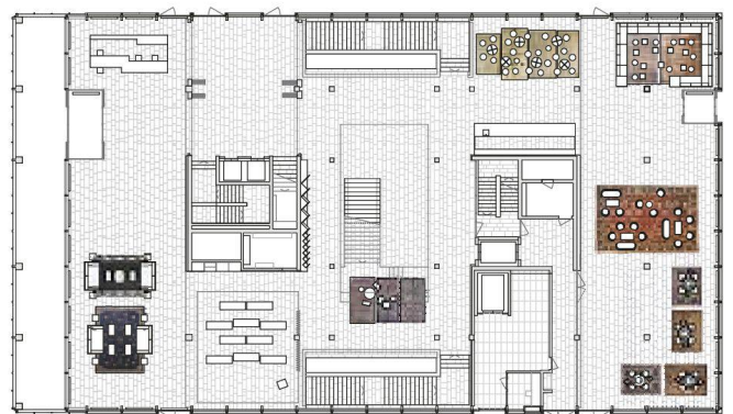
Die Welt zu Gast bei Novartis: Afrika, China (oben) und Persien (links) als möblierte Inseln im Foyer des Visitor Center