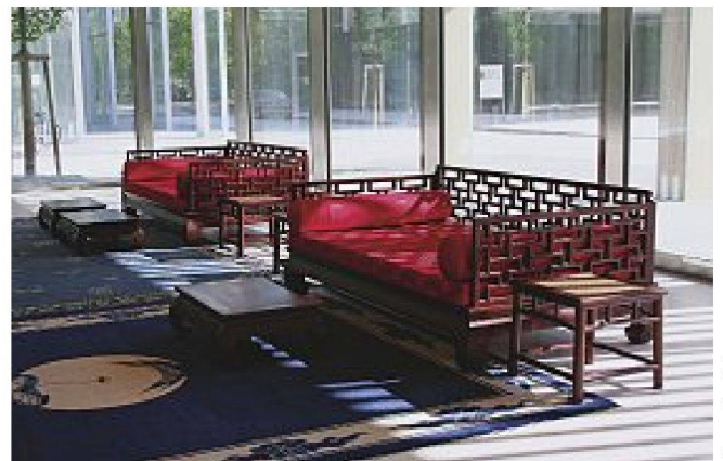
Bilder: Markti Architekt