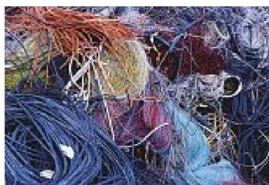
oben links: Einladungskarte Ausstellung Materialarchiv. – Bild: Grafik Tim A. Landheer, ©Gewerbemuseum Winterthur rundum: Materialien aus der Sammlung: Keramikröhren, Aluminium, Tierhaare, Kunststoffkabel. – Bilder: Stephanie Tremp, ©Gewerbemuseum Winterthur

tischen Grundlagen dazu zu präsentieren. Der Abend war trotz der Weite des Feldes spannend und bekam einen aus der Ankündigung noch nicht ablesbaren Zusammenhang, wenn es auch interessant gewesen wäre, die Positionen der drei Vortragenden in einem Gespräch zu konfrontieren. Gerade zwischen Wieser und Roche wäre es zwischen Theorie und Praxis eventuell zu interessanten Kollisionen gekommen. Schliesslich weist Wieser ja auf die synthetischen Materialien als