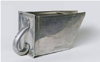
Gebrauchte Aluschütte: Was sagen Kratzer, Beulen und Verfärbungen?

erscheinungen oder vermeintlichen Schadensphänomenen steckt oft eine bedeutungsträchtige Ästhetik, die dem Material oder dem Objekt im «Originalzustand» nicht nachsteht. So hat sich beispielsweise das Korrosionsprodukt von Eisen, Rost, heute längst als ästhetischer Oberflächeneffekt in Designprozessen etabliert. 6