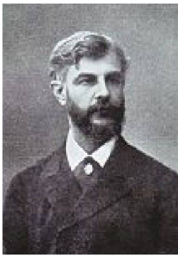
Heinrich von Geymüller, Paris 1886.