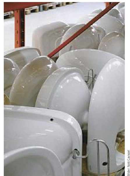
Bilder: Nott Caviezel