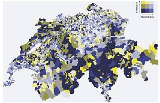
Das Nachhaltigkeitsratingsystem von Wüest & Partner.