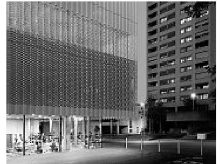
Neubau Sporthalle Hardau, Zürich, 2007 Roger Weber, Zürich, weberbrunner architekten