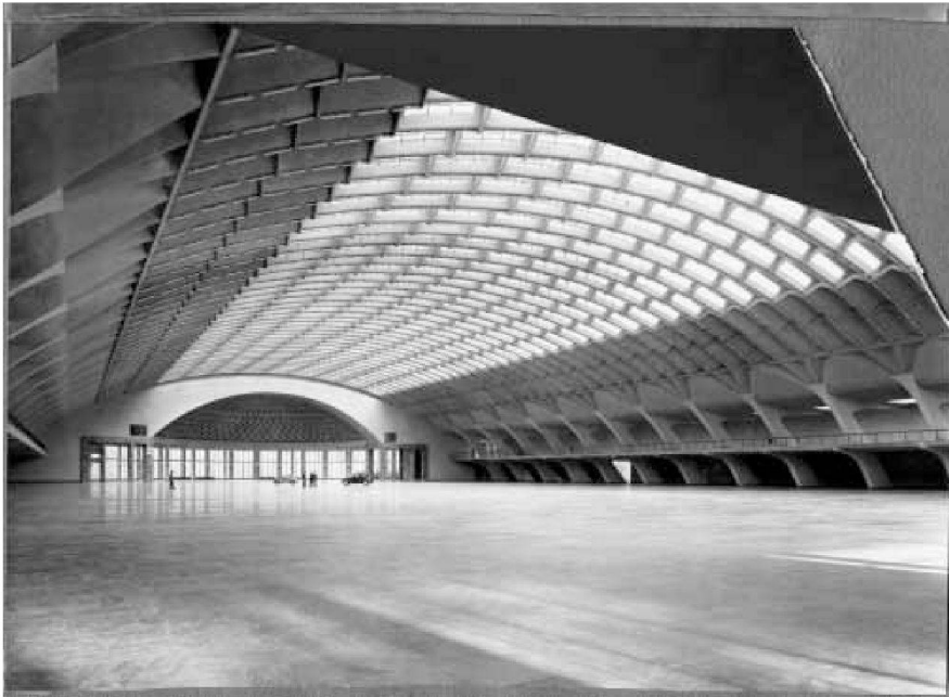
Palazzo delle Esposizioni in Turin (1948): Einrichtung des Automobilsalons kurz nach Fertigstellung.