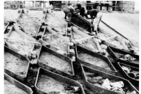
Unten: Einstellhalle für Landwirtschaftsmaschinen in Torre in Pietra, Rom (1945): Die Drahtzementformen des Dach-Tragwerks werden zur Überprüfung der Geometrie neben der Baustelle auf eine aufgeworfene Negativform aus Erde gelegt.