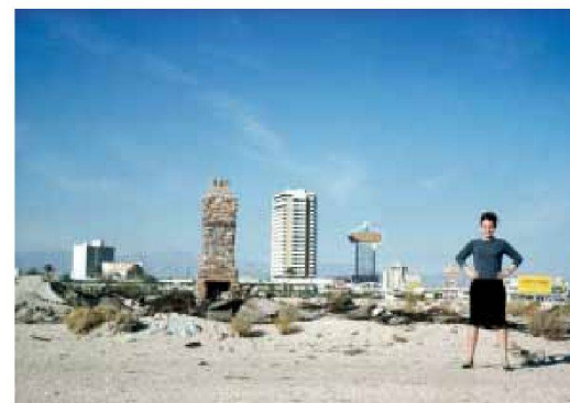
Oben: Erstes Bild aus einer Sequenz, Upper Strip, Fahrtrichtung Nord, Las Vegas, 1968.