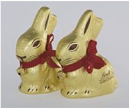
Der Goldhase: in die Form des Überbringertiers gegossen

sofort erkennbar und erinnern sogar in der Anwendung ans natürlich gewachsene Original. Eine grosse Formenvielfalt findet sich auch in der Geschichte der Schokoladenverpackungen. Bis heute im Handel sind die beliebten Hasen im Goldmantel (Entwurf 1952, Linth & Sprüngli AG, Kilchberg). Nur vermittelt die Hasenform keine Informationen über Herkunft oder Qualität der verwendeten Schokolade. Anders als die Schokoladenmarke Milka, die mit einer Lila Kuh wirbt, giesst Lindt ihr Produkt in die Form eines wirklich phantastischen Tiers: des Osterhasen als Überbringer des süsseren Geschenks. Das ist beinahe so, als wollten sich Würste in der Form eines Jägers verkaufen.