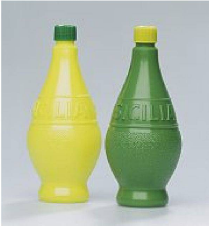
Die Form vermittelt den Inhalt und lässt sich wie das Original auspressen