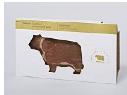
Eine elegante Lösung für die Präsentation von einem Stück Beef