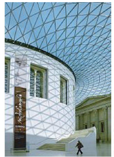
Foster + Partners, Überdachung des Great Court im British Museum, London 1998–2000.

Der Übergang von als System gedachter Architektur zum einzelnen Konstruktionssystem wird anhand weiterer Exponate veranschaulicht: So werden neben dem Mero-Raumknotensystem von