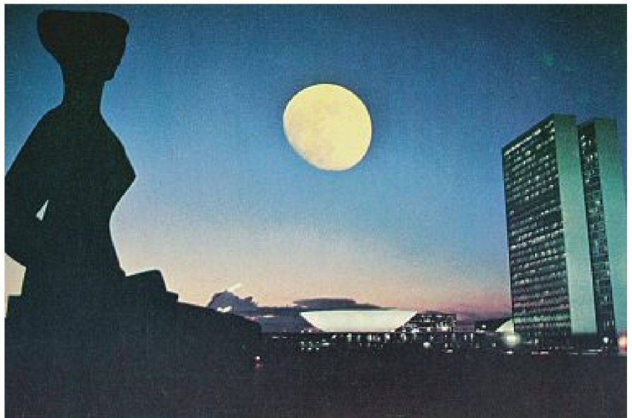
Brasília bei Nacht, drei Postkarten.