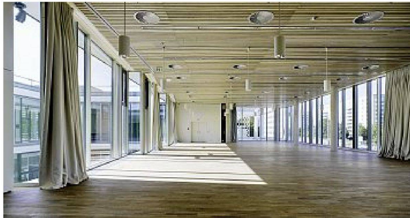
Restaurierter Konferenzsaal mit restaurierter Holzdecke und neuer Gebäudetechnik.

Eisbar, vier Ladenpavillons sowie das Café Moskau als Leitender Architekt verantwortlich und, bei aller Individualität der Einzelbaukörper, zu einem beeindruckenden Ensemble zusammengeführt. «Charakteristisch ist der Gegensatz von weitgehender architektonischer Gleichheit und dennoch unterschiedlicher, der jeweiligen Bestimmung entsprechender Eigenatmosphäre», beschrieb Kaiser selbst die Absicht, seine Solitäre dem Prinzip der Seriellen zu unterstellen. Gestaltungsmotive der industriellen Serienproduktion bestimmten ja auch die umgebende Wohnbebauung; im Pathos modernistischer Technikbegeisterung wurden sie als die eigentlichen Signale des Fortschritts gefeiert.