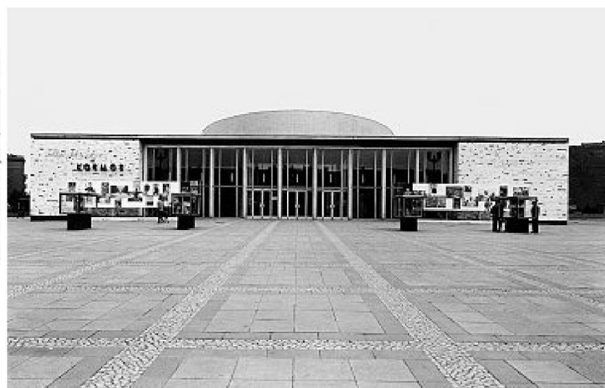
Kino Kosmos, 1960–1962