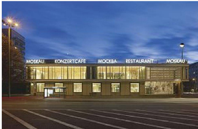
Konzertcafé Moskau nach der Sanierung.