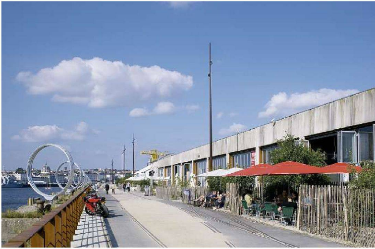
Quai des Antilles mit den «Anneaux de Buren» des Künstlers Daniel Buren und dem «Hangar à bananes».

lenkte: auf Kais, Ufer, Strassen, Wege. Der nicht mehr erneuerte Vertrag mit Chemetoff beendet nun dieses Kapitel.