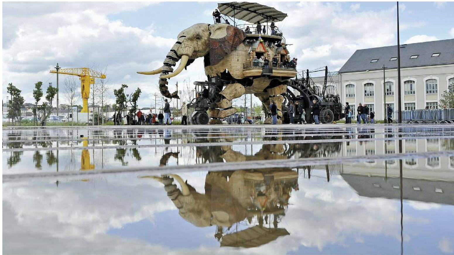
Öffentlicher Raum bei den ehemaligen Werftanlagen mit dem neun Meter hohen mechanischen Elefanten.

standen, die über mehrere Inseln verstreut lagen, war die Stadt zeitweilig der wichtigste Hafen, von dem aus Frankreich den Sklavenhandel betrieb. Die Stadt bezeichnet auch den Übergang zweier Kulturräume: Der nördliche Stadtteil mit seinen Schieferdächern ist bretonisch geprägt; passiert man die Loire, begegnet man auf dem südlichen Ufer Ziegeldächern, Vorboten der südlichen Vendée. Am Fuss der Oberstadt wuchs eine Kette von Inseln zusammen, teils auf natürliche Art, teils auf künstliche Weise durch Auffüllung. So ist im Lauf der Jahrhunderte die Ile de Nantes entstanden. Die verschiedenen Teile der Insel trugen eigene Namen: Feydeau, Beaulieu, Sainte-Anne. Erst Ende der Neunzigerjahre kam der Name Ile de Nantes auf, für ein urbanistisches Konzept der Stadt, die dem Fluss, auf den sich bis Ende der Achtzigerjahre die Industrie konzentriert hatte, den Rücken kehrte.