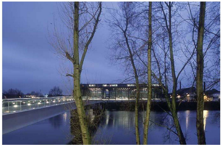
Passerelle Victor Schoelcher von Barto + Barto, 2000–2001, mit Palais de Justice von Jean Nouvel, 2000.