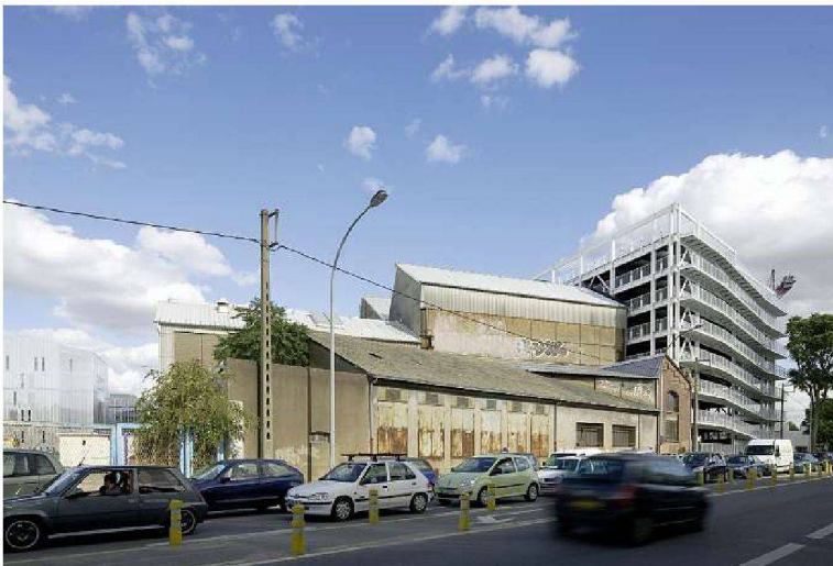
Parking des Machines, Barto + Barto, 2009.

résumé Point de fuite Ile de Nantes Depuis la guerre, Nantes vient de vivre la décennie la plus bouleversante pour son urbanisme. Le cœur de la métropole a basculé vers ce vaste territoire central qui est l'Ile de Nantes, où émergent des nouveaux lieux de polarité qui n'ont pas nié le passé industriel de l'île, mais au contraire l'ont redécouvert, réutilisé et sublimé. A la fin des années 90, l'Ile de Nantes est devenue un concept d'urbanisme forgé par une ville qui tourna le dos au fleuve, lieu d'activités industrielles jusqu'à la fin des années 80. Alors qu'un réseau moderne de tramway transformait la ville, l'Ile de Nantes resta figée – heureusement. Au lieu d'y implanter un quartier d'affaires comme tous les acteurs économiques le souhaitaient, sa transfiguration et sa révitalisation s'est faite de manière différente. Alors que la ville n'a pas échappé à une structuration en étoile de vastes centres commerciaux qui jalonnent la périphérie, le centre ville allait se vider progressivement. L'Ile de Nantes s'est donc vue investie d'une mission de nouvelle centralité au cœur d'une attractivité urbaine renouvelée: l'usine LU, nouvel espace culturel