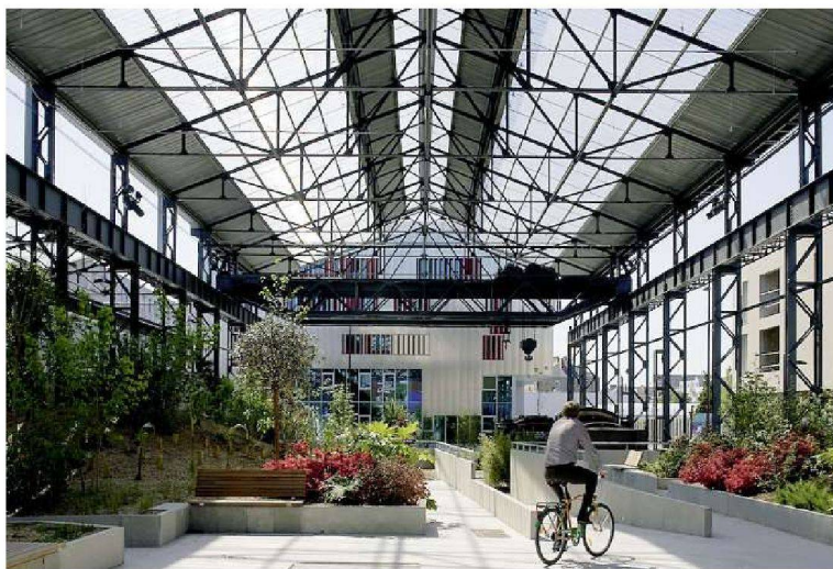
Jardin des Fonderies, Atelier Doazan-Hischberger, 2009.