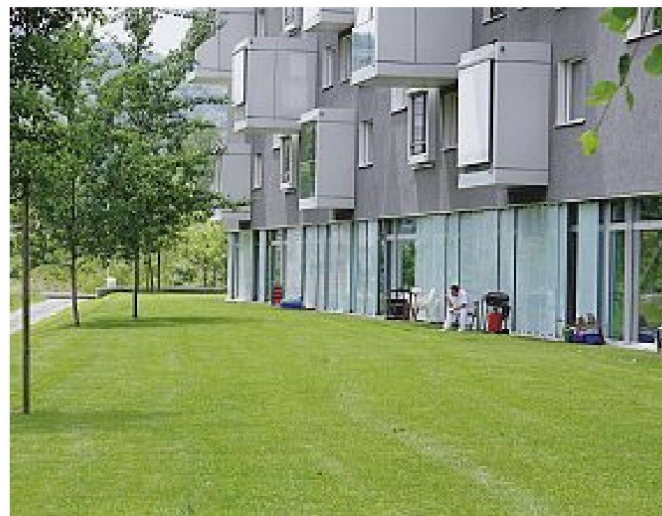
Andreaspark Zürich-Leutschenbach (Bob Gysin + Partner Phase 1; Fischer + Visini Architekten Phase 2. Bushaltestelle mit Durchzug? Unter dem Dach befindet sich ein Sandkasten. Hochfrisiertes Grün im Trog und auf dem Dach. Kunst als Wahrzeichen. Rudimentäre Raumbildung, keine Baumgruppen, minimale Pflanzenauswahl Aussenraumnutzung vergessen.