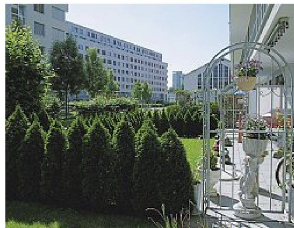
Siedlung CeCe-Areal Zürich Affoltern (Leopold Bachmann und seine Stiftung Architekturbüro: Cerv und Wachtl). Zeitgenössische ökonomische Wohnmaschine: In dieser Siedlung gab es zunächst praktisch gar keine Grünraumgestaltung ausser gesetzlich vorgeschriebene Spielgeräte – noch nicht einmal die Trennwände zwischen den Wohnungen waren eingebaut – bis etliche Beschwerden den nachträglichen Einbau veranlassten und engagierte Mieter im Erdgeschoss einfach ein paar Pflanzen in die offene Rasenfläche gesetzt haben. Heute dürfen offiziell (mit Verfügung im Mietvertrag) kleine Privatgärten vor den Wohnungen gepflanzt werden.