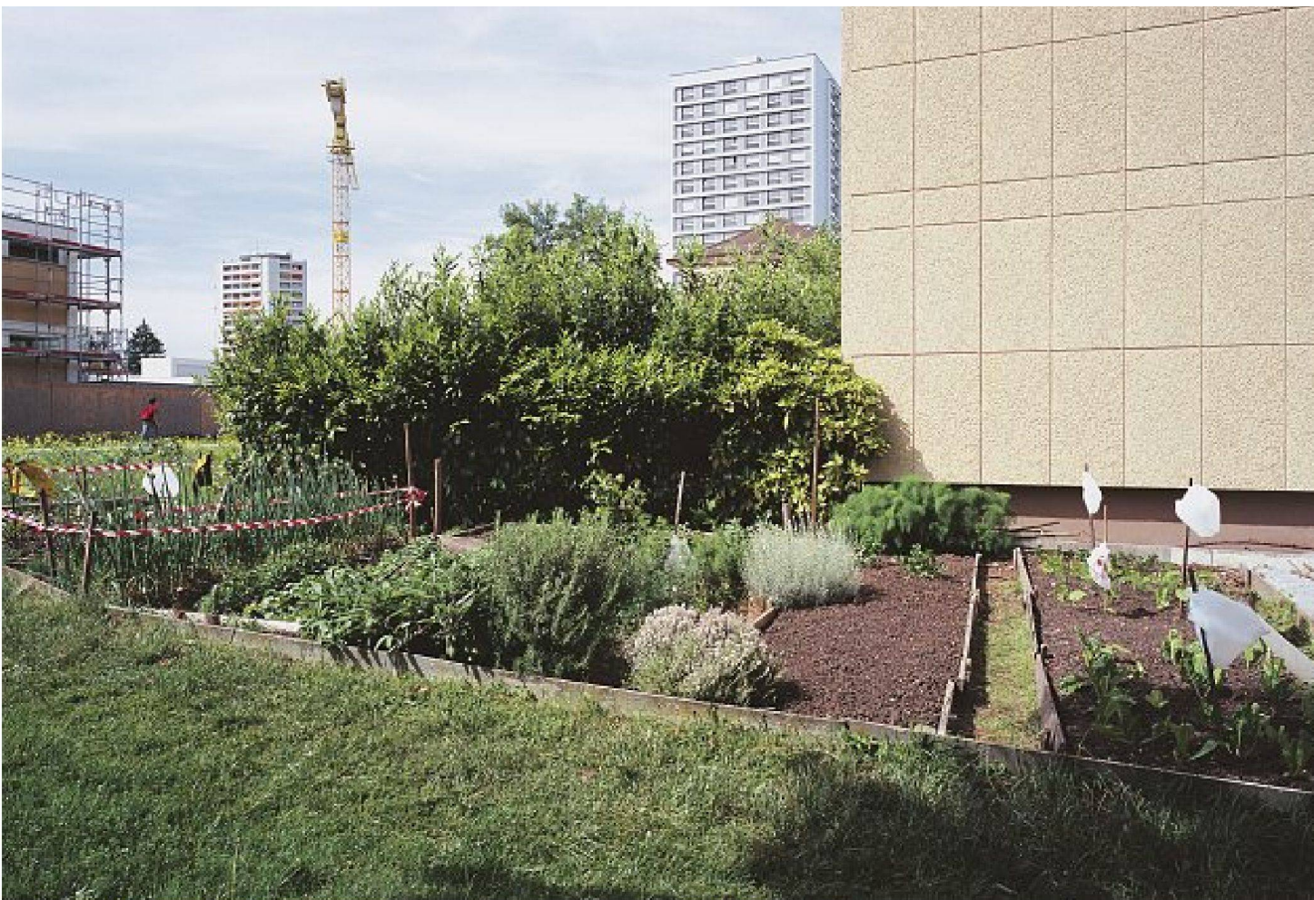
Gärtnern im Windschatten des Hochhauses in Schwamendingen.

dant pour l'aménagement des espaces extérieurs aux immeubles. Par analogie avec la densification des constructions, il s'agit de développer des procédés de densification des espaces verts. Aujourd'hui, ces derniers se présentent le plus souvent comme des espaces anonymes, accessibles à tous les regards, peu différenciés et offrant peu de possibilités d'appropriation. Dans le meilleur des cas, ils ont un effet visuel esthétique-abstrait, mais ils tiennent rarement compte des besoins quotidiens des utilisateurs. La question des espaces de plantations appropriées, qui prennent en considération non seulement le côté socio-spatial, mais aussi les aspects écologiques et bénéfiques à la santé afin de générer plus de qualité de vie et de bien-être dans l'espace urbain, n'est pas abordée. Nous avons besoin, dans l'architecture paysagère contemporaine, d'un changement de paradigme qui englobe des approches issues des sciences sociales et orientées vers l'utilisateur.