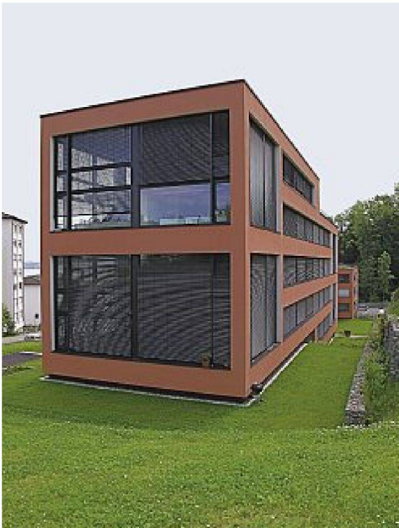
Alles etwas luxuriöser, grösser, energetischer als in den 1950er Jahren. Grafik bestimmt den Entwurf, nach wie vor kaum Anrecht, den Aussenraum mitzugestalten, Lounge-Möblierung suggeriert Wohnlichkeit im Aussenraum. Überbauung Freiesicht, Wädenswil (Wagner Architekten, Fischer Landschaftsarchitekten), Wädenswil. Verbindung zwischen Innenraum und Aussenraum nur optisch über die übergrossen Fensterfronten; der Grill bleibt wie verloren an der Gebäudecke stehen.

Pflanzenkübeln verstellt, um Intimität zu schaffen. In den grünen Aussenräumen geschieht dies – sofern überhaupt möglich – ebenso.