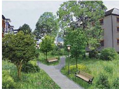
Computergenerierte Fotos der Studie BiodiverCity, die für die Befragungen eingesetzt wurden. Artenvielfalt hängt vom Grad der Versiedelung, einer Vielfalt der Strukturen, der Anzahl Bäume und einer extensiven Bewirtschaftungsintensität ab. Wichtig für die Bewohner ist der Grad der Nutzbarkeit, der Reiz und die Komplexität der Strukturen sowie die Zugänglichkeit von Grünräumen. – Bilder: Roland Hausheer, Hochschule Luzern Design & Kunst, Illustration Non Fiction.