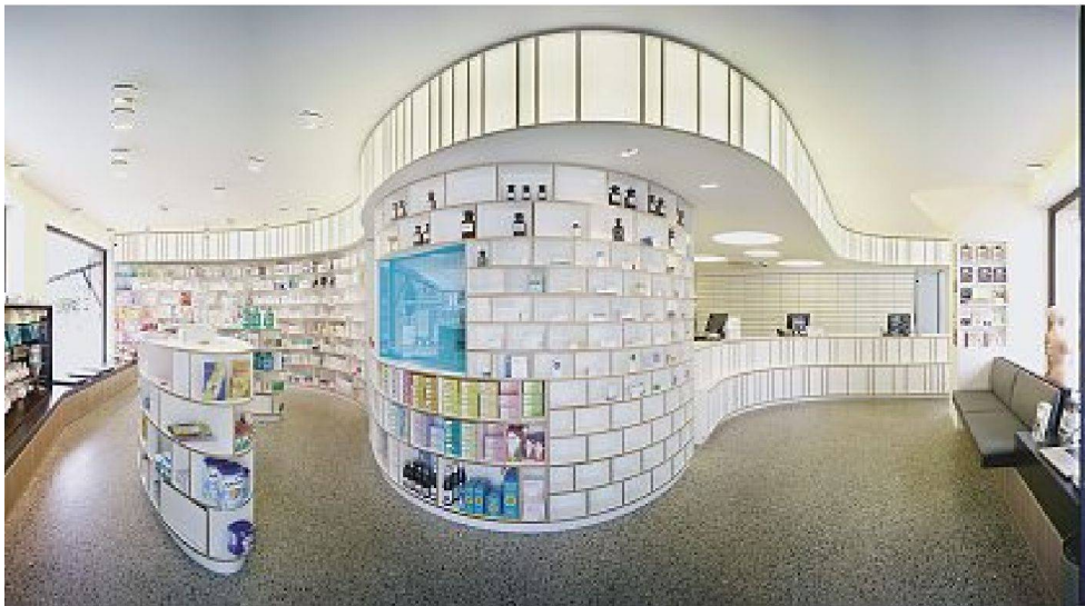
Gesamtansicht der umgebauten Apotheke durch das Fischauge-Objektiv (oben), Verkaufstheke und Medikamentenbereich (unten links), Selbstbedienungs-Regale (unten rechts)