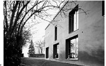
26 Trublerhütte Schlieren, 2007 Mark Aurel Wyss, Zürich, Rossetti+Wyss Architekten