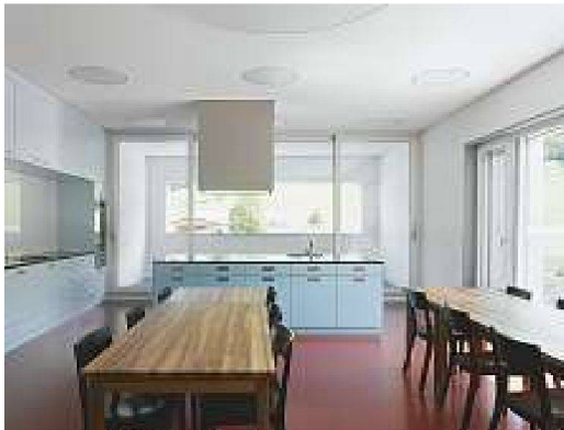
Schulungsraum im Obergeschoss (Bild oben) und Grossküche mit Induktions-Förderband.

Bauherrschaft: Klinik Littenheid, Littenheid Immobilien AG Architekten: Galli Rudolf Architekten AG, Zürich; Mitarbeit: Fabian Stettler, Anja Widmer Bauingenieur: Grünenfelder + Keller Wil AG, Wil Gebäudetechnik HLKS: Amstein + Waltert AG, Frauenfeld Akustik + Bauphysik: Wichser Akustik & Bauphysik AG, Zürich Kunst am Bau: Pascal Seiler Termine: Planungsbeginn 2008, Realisierung 2009–2010