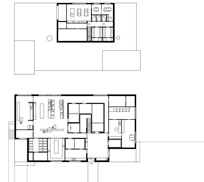
Grundrisse Erdgeschoss und Obergeschoss, rechts: Betriebsschema