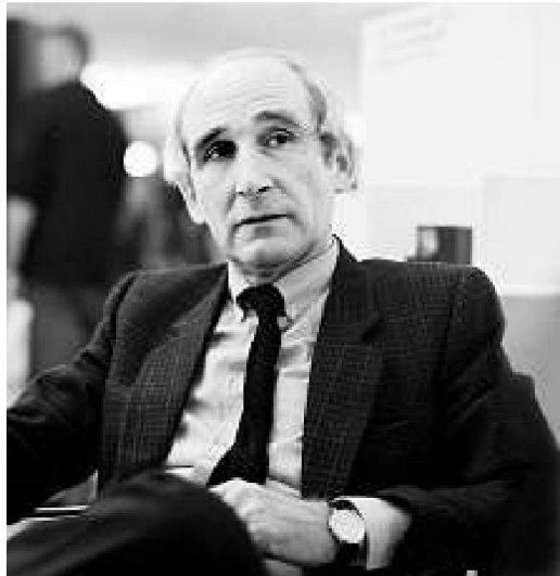
Porträt anlässlich des «Forum kreativer Fabrikanten» an der Schweizer Möbelmesse, Bern 1987