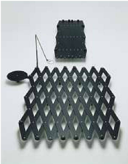
Scherenbett Mod. Nr. 990, Kurt Thut 1990