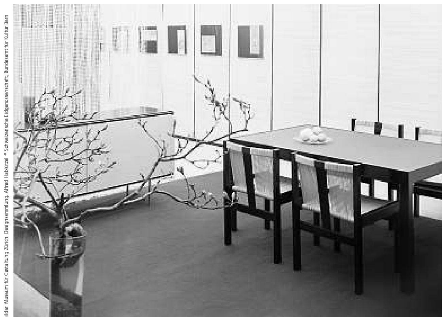
Eröffnungsschaufenster im neuen Ausstellungspavillon bei teo jakob, Bern 1956