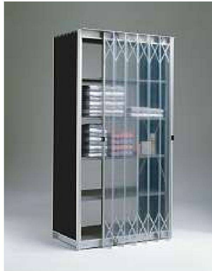
Balgenschrank Mod. Nr. 399, Kurt Thut 1998