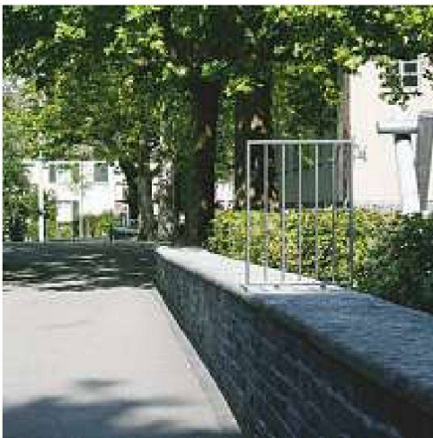
Normierung ad absurdum: Ab einer Höhe von 80 cm müssen Bauteile gemäss der SIA Norm 358 «Geländer und Brüstungen» gegen die Gefahr eines Absturzes gesichert werden; beim Schulhaus Milchbuck in Zürich gilt dies auch für eine Stützmauer, die als Sitzgelegenheit vor gut 80 Jahren entworfen, entlang eines abfallenden Wegs immer höher wird.