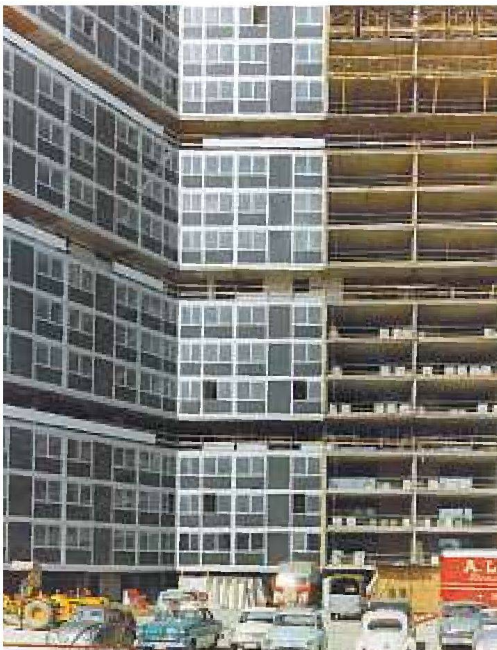
Cité du Lignon, Baustelle um 1967, Montage der Aussenhülle