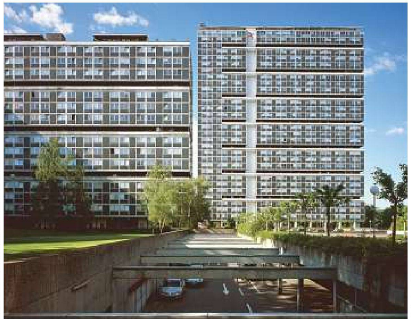
Cité du Lignon 2010