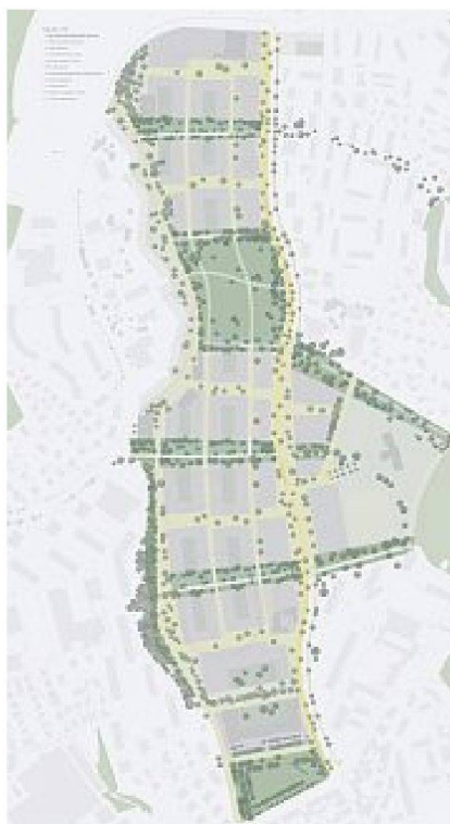
5. Preis: Studio d'architecture Jean-Daniel Paschoud