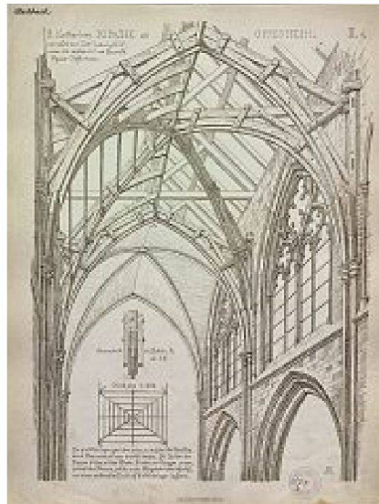
«S. Katharinen Kirche zu Oppenheim, zerstört zur Zeit Ludwig XIV, neuerlich restaurirt von Baurath Ignaz Opfermann»

Bilder aus Ernst Gleditsch, Vorlagelithen zur Baubaukonstruktionslehre, Zürich 1868-1871.