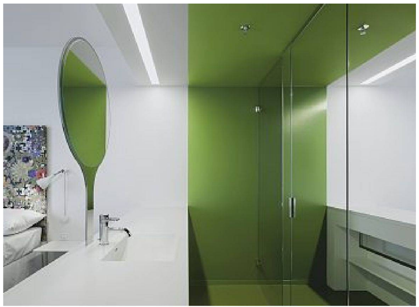
Badezimmer mit Spiegel und Waschtisch

mit den Zürcher Innenarchitekten von IDA 14 die Spiegelungen bis in die einzelnen Zimmer hineinragen. Die Waschbecken und der funktional dazu gehörende Spiegel werden aus dem üblichen fensterlosen Badezimmer rausgeholt und als eigenständige Objekte im Hauptraum installiert. Aus dem Waschtisch, der tatsächlich ein Tisch mit grosser Ablagefläche ist, ragt aufrecht ein auf das Zehnfache hochskalierter Handspiegel hervor, in dem sich die verspiegelte Wand zum eigentlichen Badezimmer spiegelt. Wer sich hier rasiert oder schminkt, sieht sich selbst, das Hotelzimmer in doppelter Ausführung und kann bei Bedarf über den Spiegelrand hinaus durch das Fenster auf den Wald blicken. Viel mehr Manierismus lässt sich wahrscheinlich kaum in ein einzelnes Bauteil packen wie in diesen sich verselbständigenden Spiegel. Man kann leider nur mutmassen, was für eine Erzählung Jorge Luis Borges dazu eingefallen wäre. ■