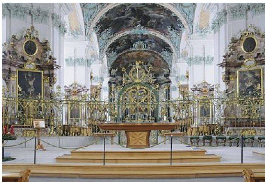
Das aktuelle Provisorium