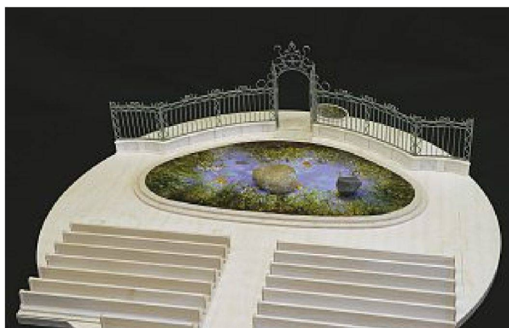
«Alpsteinkloster» von Pipilotti Rist, Zürich