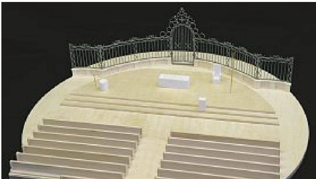
«Präsenz» von Aires Mateus Architekten, Lissabon