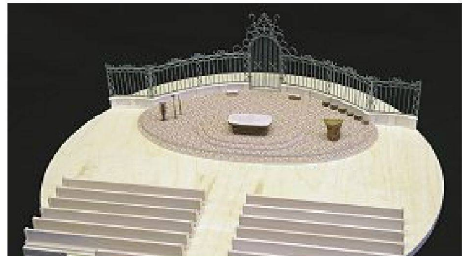
«Wood to Bread» von Jorge Pardo Sculpture, Los Angeles