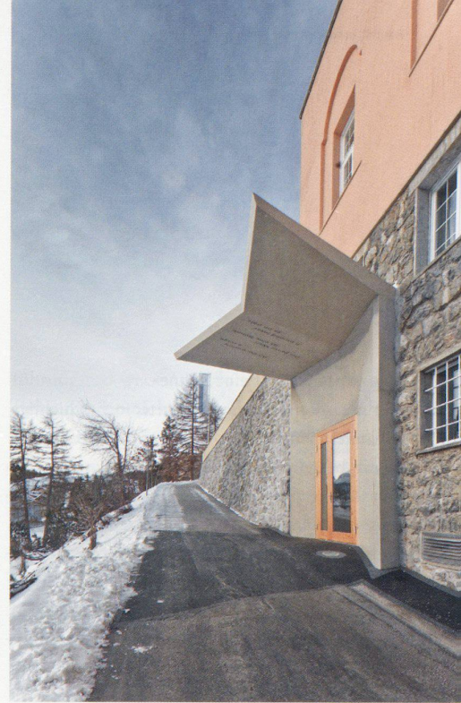
Neuer Eingang im Sockelgeschoss

Die Mittelbühne ist dreiseitig von Sitzstufen umgeben. Eine Estrade, durch hellgraue Vorhänge vom Theaterraum abtrennbar, umläuft die Sitzreihen. Sie dient als Zutritt, kann aber auch als erweiterte Raumschicht in die Inszenierung mit einbezogen werden. Eine in die Bühne integrierte Klappe ermöglicht den direkten Zugang des Untergrundes. Die Wände des Bassins können zusätzlich mit (farbigem) Licht bespielt werden. Die Raumbühne erweitert sich so zwischen den Sitzstufen hindurch in eine fast sphärische Tiefe. Während für das Wettbewerbsprojekt Sitzstufen in der Tradition des Globe Theatre angedacht waren, entschied man sich in einem weiteren Schritt zugunsten des Komforts für den Einbau von Klappstühlen. Da sich kein geeignetes Standard-