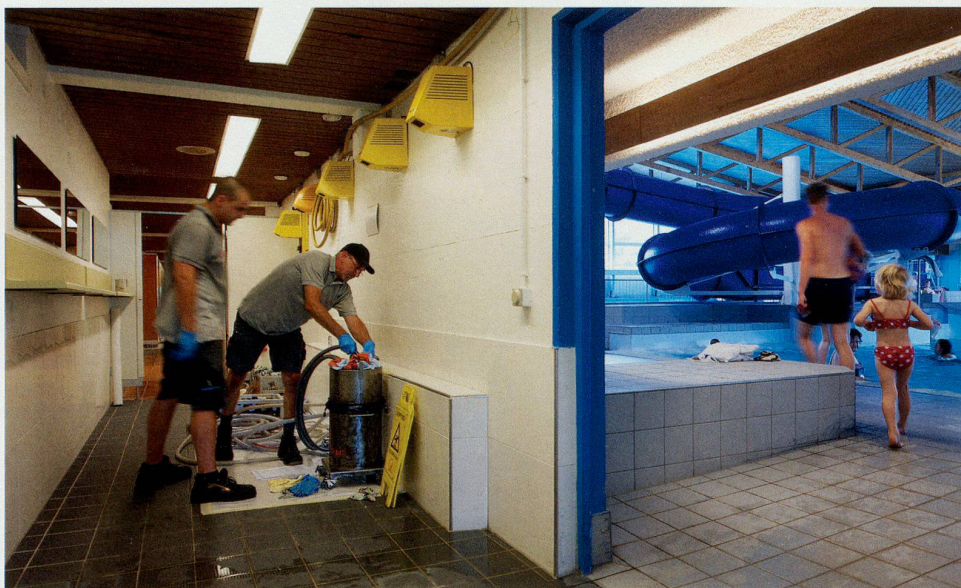
Rohrrinnensanierung mit HAT-System: Keine Baustelle. Kein Aufreissen. Kein Bauschutt. Kein Lärm. Also auch keine Betriebsunterbrechungen.

Teure Komplettsanierungen lassen sich umgehen, wenn rechtzeitig eine Zustands- und Machbarkeitsanalyse durchgeführt wird. Eine Analyse des Heizwassers, beispielsweise, liefert mit Hilfe eines mobilen Labors bereits zuverlässige Parameter vor Ort. Mit dem Einsatz einer Wärmebildkamera werden ausserdem Bodenheizungs-Rohrverlauf sowie energetische Montagemängel aufgezeigt.