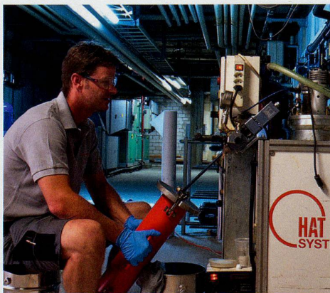
Nach dem Mischen und Dosieren wird das Beschichtungsmaterial in Kartuschen für die eigentliche Innenbeschichtung vor Ort abgefüllt.

Mit HAT-System werden Rohre, wie gesagt, von innen saniert. Zunächst wird mit Druckluft das Restwasser aus dem Heizungssystem geblasen und sauber entsorgt. Dann werden die Rohrinneflächen gereinigt: Ein Spezialkompressor presst ein von Fall zu Fall anders abgestimmtes, chemiefreies Granulat an die Rohrwände und entfernt Schlammrückstände und Verkrustungen selbst innerhalb kleinster Winkel und Ver-