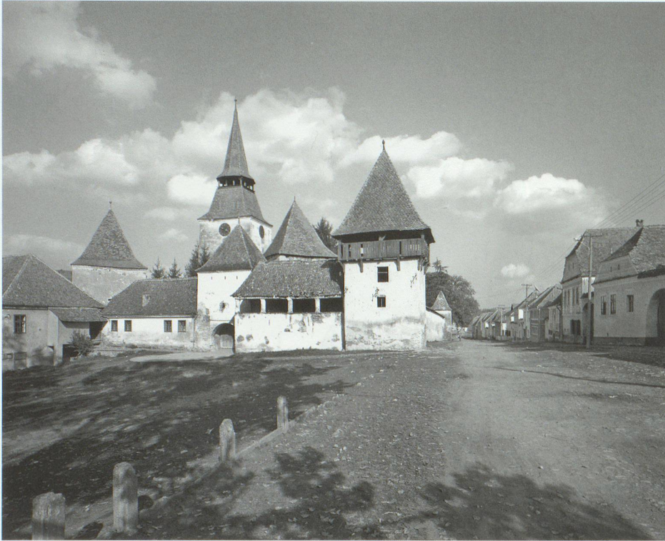
Archita (Archeden): Ursprünglich romanische Basilika, im 16. Jahrhundert zur Wehrkirche ausgebaut Viscri (Deutsch-Weiskirch): Um 1500 zur Wehrkirche ausgebaut, Türme aus dem 17. Jahrhundert