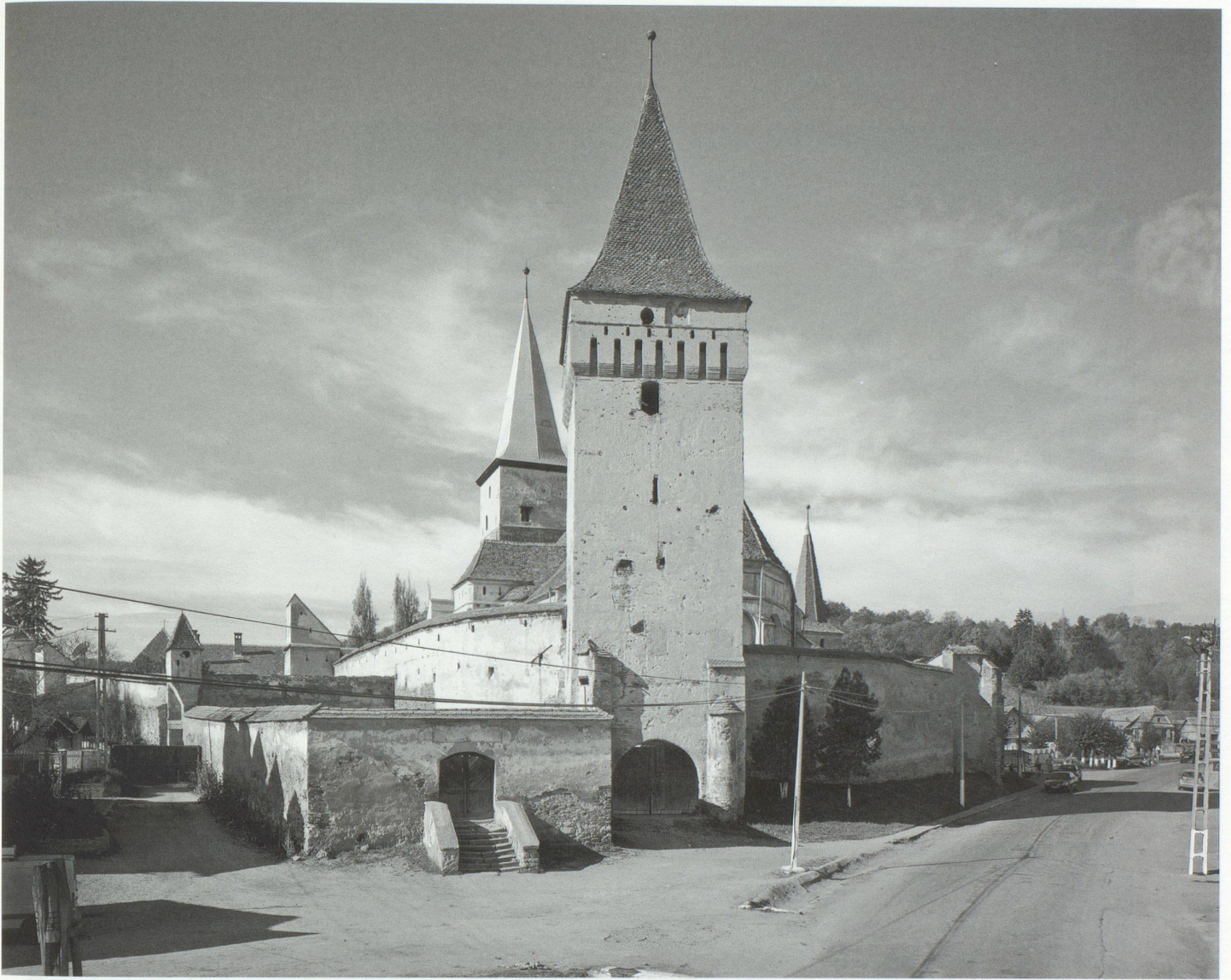
Mosna (Meschen): Gotische Hallenkirche des 15. Jahrhunderts mit Ringmauer, Wehrtürmen und Zwinger