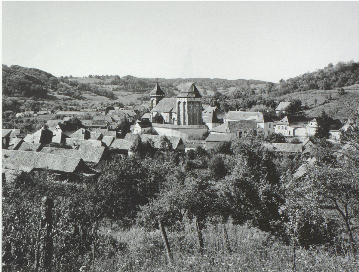
Valea Viilor (Wurmloch): Um 1500 zur Kirchenburg umgebaut Șeica Mică (Kleinschelken): Pfeilerbasilika des 14. Jahrhunderts mit als Wehrturm ausgebautem Chor