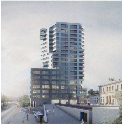
Implenia Generalunternehmung mit Bovet Jeker Architekten, Bachelard Wagner Architekten und Verzone Woods Architekten