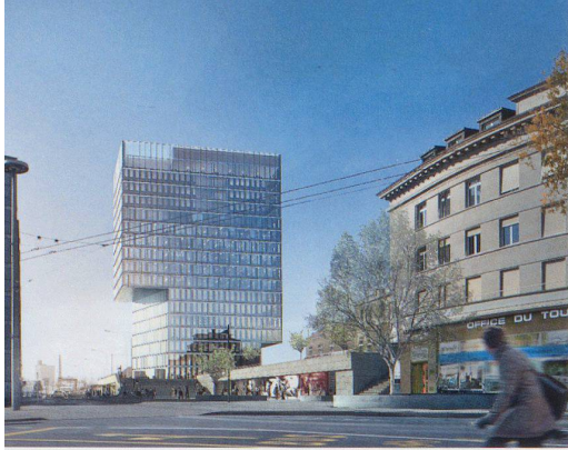
HRS Real Estate mit Richter – Dahl Rocha & Partner Architekten und L'Atelier du Paysage Jean-Yves Le Baron