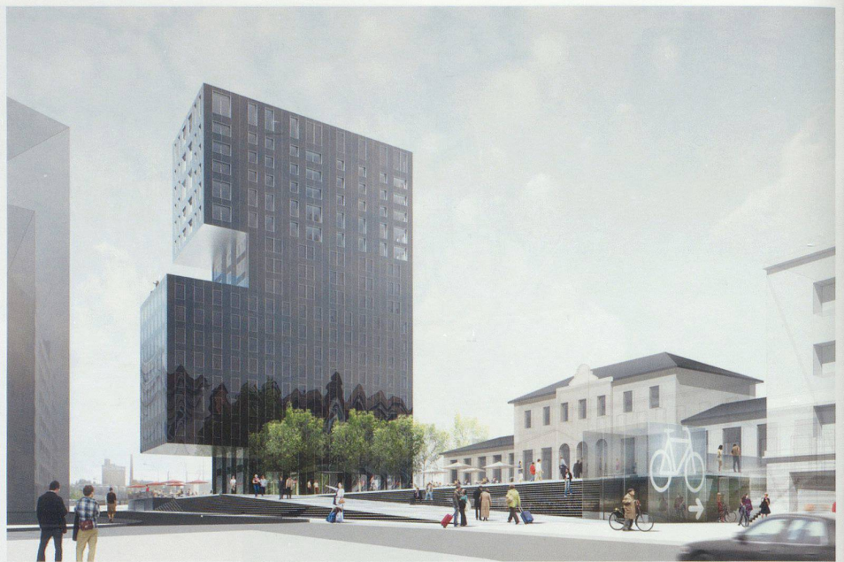
Steiner Generalunternehmung mit Dominique Perrault architecture und Architram architecture et urbanisme