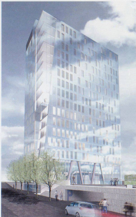
Losinger Marazzi mit Luscher Architekten