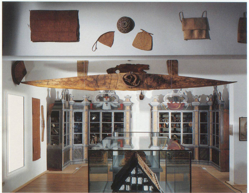
Kunst- und Naturalienkammer der Franckeschen Stiftungen zu Halle.