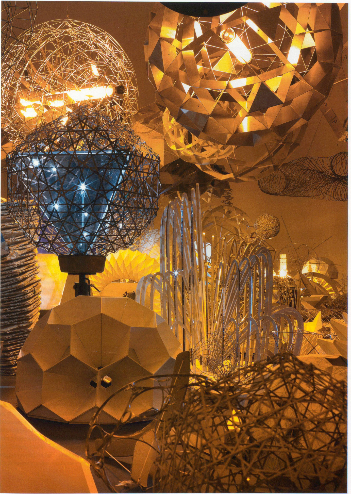
Bilder: Ian Reeves (links), Jens Ziehe (rechts), Courtesy of the San Francisco Museum of Modern Art; Courtesy the artist, neugiertschneider, Berlin und Tanya Bonakdar Gallery, New York © 2003 Olafur Eliasson