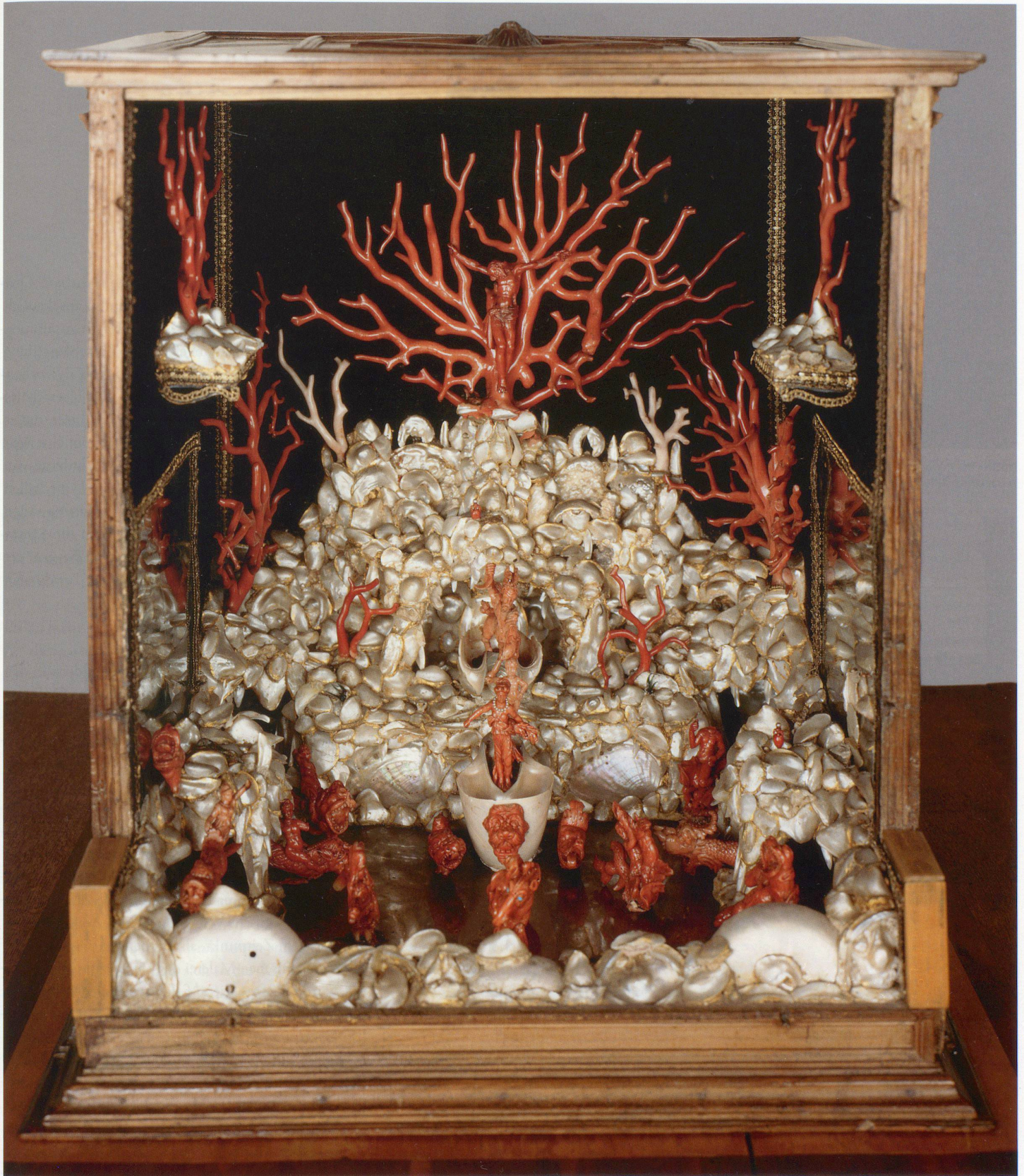
Korallenkabinett, Schloss Ambras, 2. Hälfte 16. Jahrhundert.