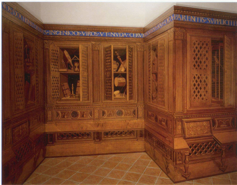
Studiolo des Herzogs von Montefeltro in Gubbio mit intarsierten Perspektivdarstellungen.