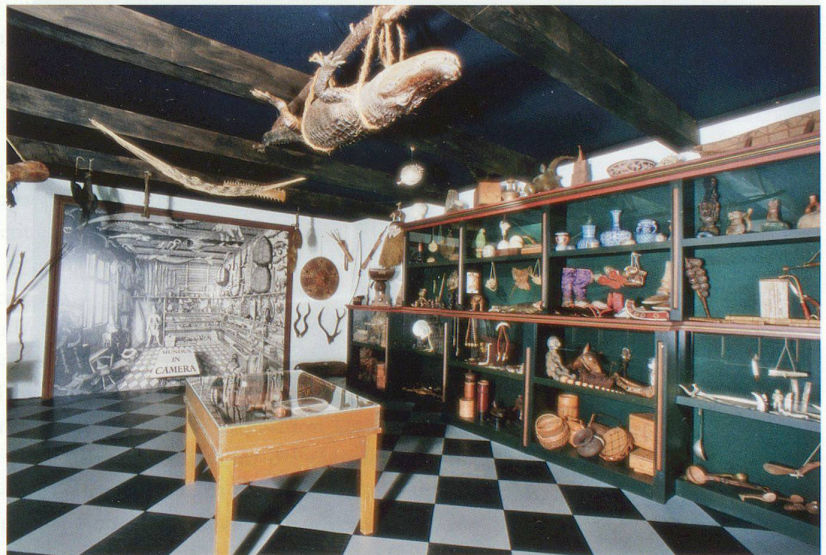
Rekonstruktion der Wunderkammer des Kopenhagener Arztes Ole Worm in der Ausstellung des Völkerkundemuseums der Uni Zürich «Die Welt im Zimmer» 1998.