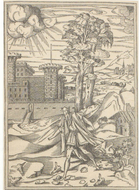
Philibert de l'Orme, «Der schlechte Architekt», in: Le premier tome de l'architecture, Paris 1567

Die ausgewählten Exponate dienen jedenfalls plausibel als «Aufhänger» und Stichwortgeber; Zusammenhänge erhellt der Katalog. Skizzen und Planzeichnungen, Druckgrafik, und Architekturmodelle dokumentieren in der Ausstellung das reale Schaffen der Architekten über die Zeiten hinweg. Porträts mächtiger Männer zeigen anschaulich, wie stark der Begriff des Bauherren in der Antike, im Mittelalter und noch bis weit in die Neuzeit hinein auf sehr handfesten Herrschaftsverhältnissen gründete; denn es sind Fürs-