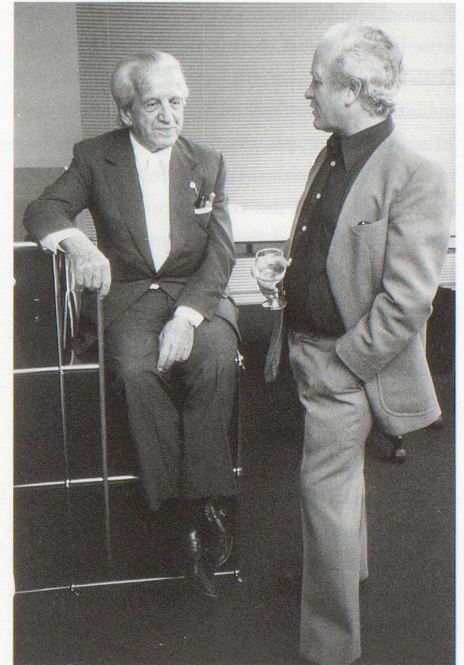
Konrad Wachsmann auf dem USM-Möbelsystem neben Fritz Haller.

Es verwundert kaum, dass Haller schon früh in Kontakt mit jenen Protagonisten des Industriellen Bauens kam, welche die Ästhetik Mies van der Rohes mit der Effizienz automatisierter Bauprozesse zu verbinden suchten. Gegenüber vielen dieser Pioniere, etwa Konrad Wachsmann oder Charles Eames, wirkte Fritz Haller, mentalitätsgeschichtlich gesprochen, wie ein stiller, doch neugieriger Beobachter, für den das Gerede über die Vorteile oder Nachteile der zunehmenden Technisierung von Architektur an der eigentlichen Sache vorbeilief. Haller, der zwischen 1966 und 1971 an Wachsmanns Institut an der University