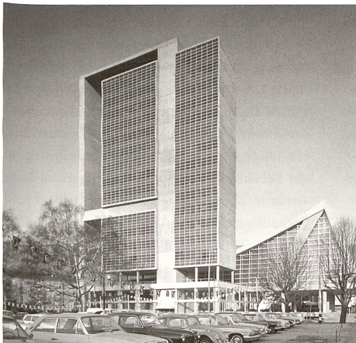
Kongresshaus Biel, Aufnahme aus den 1960er Jahren