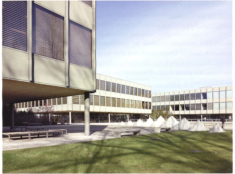
Das Gymnasium Strandboden in Biel in einer aktuellen Aufnahme