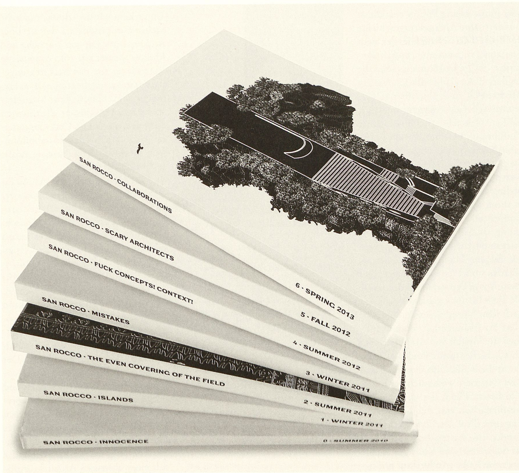
Schwarze Vignette auf neutral weissem Hintergrund: In jeder Ausgabe von «San Rocco» kristallisieren sich Erzählungen der Architektur um ein Thema.