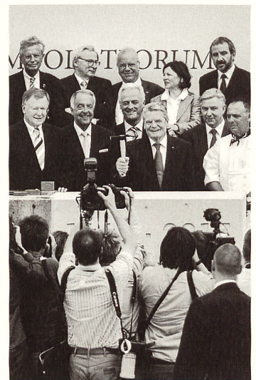
Ein symbolischer Hammerschlag eröffnet den Wiederaufbau.

Im heute Humboldt-Forum genannten Projekt sollen zukünftig die Präsentation der aussereuropäischen Sammlungen, ein Museum zur Schlossgeschichte, Teile der Zentral- und Landesbibliothek Berlin sowie der Humboldt-Universität unterkommen. Der seit seinem Wettbewerbssieg 2008 mit der Planung des Baus betraute Architekt Franco Stella