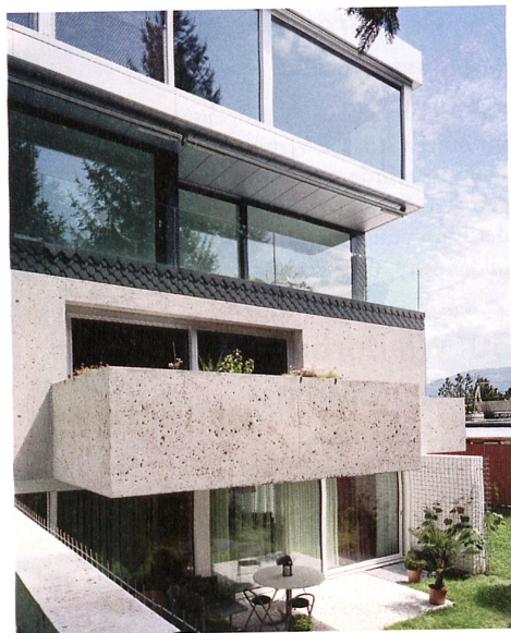
Lukas Lenherr stapelt fünf Häuser zu einer Mittelland-Collage.